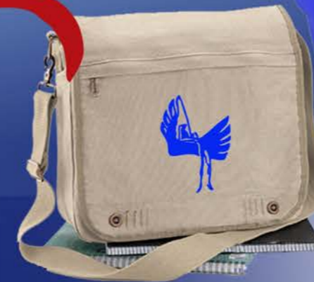
Beschreibung siehe Rückseite

Alle Preise verstehen sich inkl. 19 % MwSt. Preisänderung und Irrtum vorbehalten.