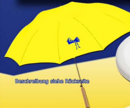
Beschreibung siehe Rückseite